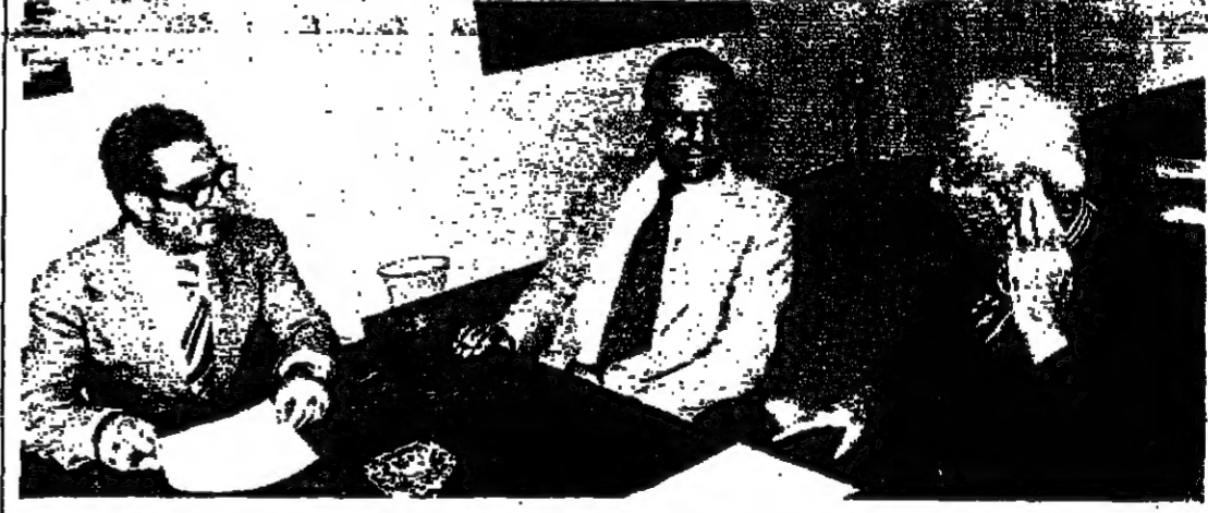
عقد وزير الداخلية الدكتور صلاح سلمان ومحافظ العاصمة المهندس مزي النمار اجتماعا مع مجلس بلدية بيروت امس ، ونوقشت فيه الخطط الموضوعة لتعمير الاسواق واقتراحات التجار على بعض خرائط الطقة التجارية . والصورة املاء من الاجتماع